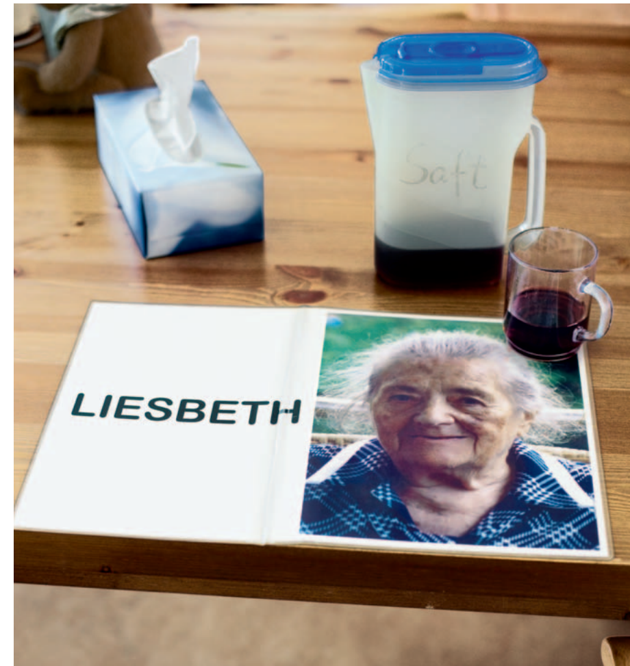
Alzheimer-Patienten benötigen Hilfen zur Orientierung.

Charakteristisch ist ihr schleichender, nahezu unmerklicher Beginn. Anfangs treten leichte Gedächtnislücken und Stimmungsschwankungen auf, die Lern- und Reaktionsfähigkeit nimmt ab. Hinzu kommen erste Sprachschwierigkeiten. Die Erkrankten benutzen einfachere Worte und kürzere Sätze oder stocken mitten im Satz und können ihren Gedanken nicht mehr zu Ende bringen. Örtliche und zeitliche Orientierungsstörungen machen sich bemerkbar. Die Betroffenen werden antriebschwächer und verschließen sich zunehmend Neuem gegenüber.