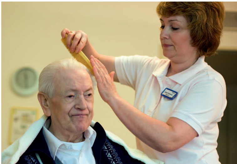
Demenziell erkrankte Menschen benötigen Hilfe bei der Körperpflege.

So lassen sich manche demenziell erkrankten Menschen auch ungern von Verwandten – vor allem von den eigenen Kindern – waschen. In diesem Fall empfiehlt es sich, für die Körperpflege