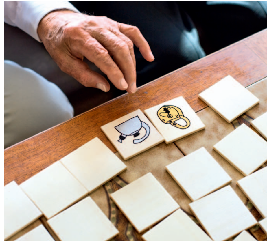
Das Training geistiger Fähigkeiten vermindert das Risiko einer demenziellen Erkrankung.

Positiv wirkt sich hingegen geistige Aktivität aus: Intellektuell wache Menschen erkranken seltener an Alzheimer als solche, die geistig kaum aktiv sind.