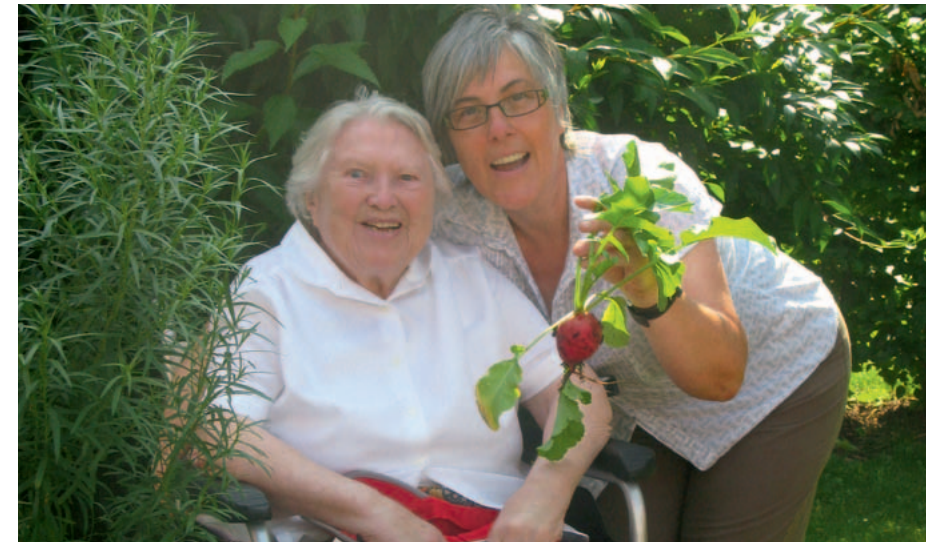
„Sinnvolle“ Tätigkeiten wie zum Beispiel Gartenarbeiten, Staubwischen oder Küchenarbeit werden von den Kranken leichter angenommen.

Die Kranken brauchen Aktivitäten, um Bestätigung und ein Gefühl der Zugehörigkeit zu erleben und um ihre quälende Unruhe zu lindern. Deshalb sollte man keinen Versuch scheuen, die Erkrankten zu motivieren und mit ihnen gemeinsam nach angemessenen Beschäftigungen zu suchen. Bei der Auswahl der Aktivitäten ist es wichtig, sowohl Unterforderung als auch Überforderung der Kranken zu vermeiden. Überforderung führt meist dazu, dass sie