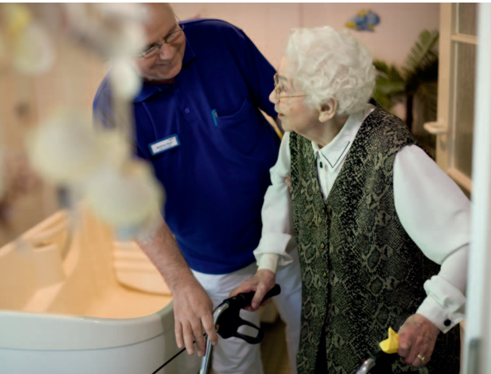
Ambulante Pflegedienste tragen mit dazu bei, die häusliche Betreuung zu entlasten.

In beiden Fällen ist es ratsam, wenn der Entschluss zur Betreuung nicht von der Hauptpflegeperson allein getroffen wird. Es hilft, wenn alle Familienmitglieder gemeinsam überlegen, wer für welchen Part verantwortlich sein wird und wie die unterschiedlichen Aufgaben gerecht verteilt werden. Das trägt auch zur Solidarität unter den Angehörigen bei. Um spätere Enttäuschungen oder Missverständnisse zu vermeiden, sollten Hilfeleistungen anderer nach Möglichkeit schriftlich festgehalten werden. Ebenso ratsam ist es, schon jetzt ambulante Pflegedienste in die Überlegungen mit einzubeziehen, die möglicherweise Entlastung bringen können. Nur wenn Sie sich von Anfang an Ihre eigenen Freiräume schaffen,