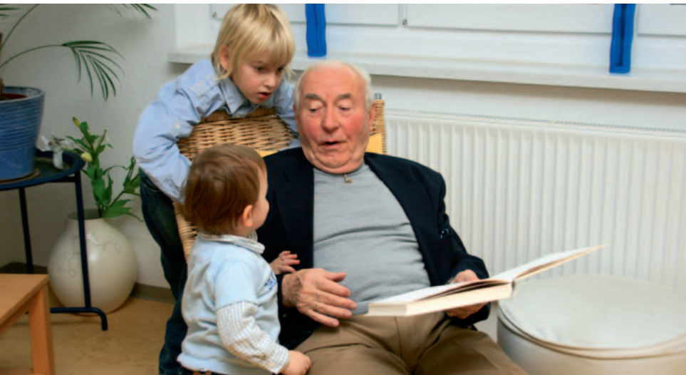
Eine frühzeitige Diagnose kann helfen, die weitere Lebenssituation von Betroffenen und Angehörigen günstig zu beeinflussen.

Auf keinen Fall sollte man den Verdacht einer Demenz verdrängen: Gerade eine frühzeitige Diagnose kann sicherstellen, dass die Betroffenen und ihre Angehörigen Zugang zu möglichen Hilfsangeboten bekommen.