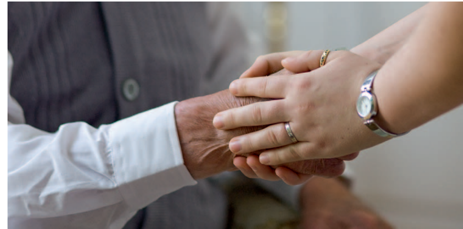
Aufmerksamkeit, Ansprache und Orientierung werden für demenziell erkrankte Menschen immer wichtiger.

Vielleicht wird für Kinder demenziell erkrankter Eltern der Rollentausch einfacher, wenn sie sich vor Augen führen, dass die Übernahme von Verantwortung für Vater oder Mutter respektvolles Verhalten nicht ausschließt. Demenziell erkrankte Menschen sind im Gegenteil sehr auf ihre Würde bedacht. Haben sie das Gefühl, zu sehr wie Kinder behandelt zu werden, können sie mit Wut oder Rückzug reagieren.